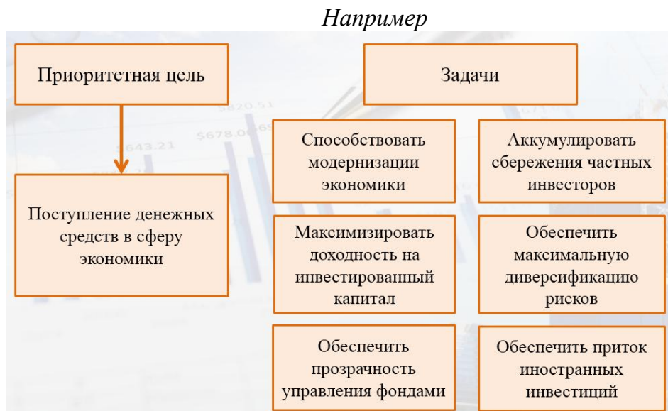
Рисунок 1. Цель и задачи инвестиционного фонда

Название рисунка указывается под изображением по центру после слов Рис. и порядкового номера рисунка.